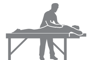
国家資格保有者の マッサージルームを設置