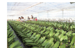
NPO法人AlonAlon(アロンアロン) オーキッドガーデンにおける胡蝶蘭の栽培