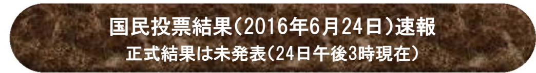
【図1】英国国民投票結果

英国は、国内の多くの分野で今後困難に直面しましょう。現在のEUの枠組みでは、EU離脱を表明後、原則2年でEUから離脱することとなっています。（徳岡）