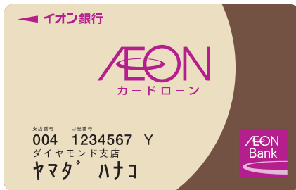
カードローンユトリプラン