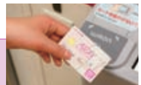
ATMでWAONのチャージができます。

また、WAONご利用後の残高がご指定の残高未満となる場合、あらかじめ設定した金額がお客さまの普通預金口座から電子マネーに自動的にチャージされる「オートチャージ機能」を付加することができますので、毎日のお買物にとっても便利です。