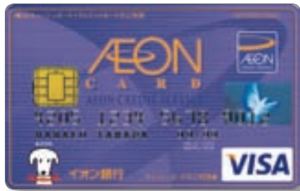
イオンカードセレクト

※WAONオートチャージ機能を設定することにより、お買物の際にWAON残高が設定金額未満となった場合に、口座から自動的に引き落としとしてチャージすることができ、即時にお支払いにご利用いただけます。