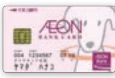
イオンバンクカード

また、イオン銀行のATMなら店舗の営業時間内はいつでも手数料無料で使えるので、急なご入用でお金が必要になったときのお引出しも安心・スムーズ。給料や年金の受取口座としてご利用いただいても便利です。