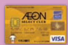
セレクトクラブ専用ゴールドカード

◎イオン銀行の住宅ローンをご契約いただき、所定の条件を満たし「イオンセレクトクラブ」にご入会されると、専用の「イオンゴールドカードセレクト」が発行され、イオンでのクレジットでのお買物が5年間毎日おトクになるサービスです。 ※割引対象となる年間のお買物金額には上限がございます。