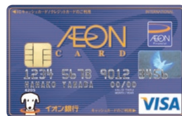
イオンカードセレクト

「イオンカードセレクト」は、クレジットカード、キャッシュカード、電子マネー「WAON」の機能・特典を1枚にまとめた多機能カードで、カードローン機能の追加も可能です。また、普通預金金利の優遇や、給与振込口座への指定、公共料金お支払いで毎月WAONポイントがたまります。