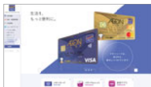
コーポレートサイト