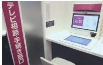
<テレビ相談・手続き窓口>