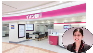
<オンライン相談サービス>