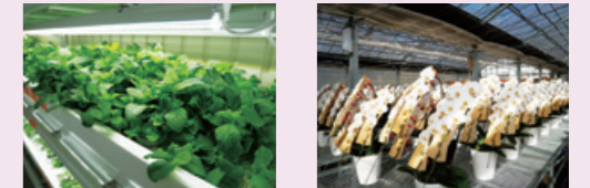
障がいのある社員の多様な就業場所 (写真左:IBUKI FARM、右:NPO法人AlonAlonオーキッドガーデン)