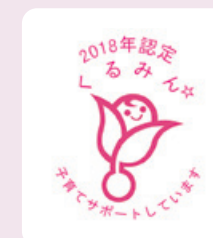
くるみん認定取得(2018年)

ロールモデルの展開、職場環境の整備・子育て支援に取組む他、イオングループにおける女性活躍の取り組みに参画し男女関係なく活躍できる機会の提供に努めております。 女性従業員向けネットワーク「Magenta Network」を立ち上げ、従業員間のつながりやライフキャリア構築支援を目指し取り組んでおります。