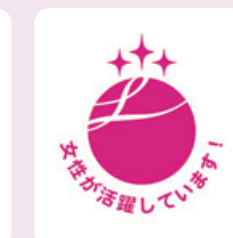
えるぼし認定取得(2016年)