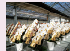
障がいのある従業員の多様な就業場所 (写真左:IBUKI FARM、右:NPO法人AlonAlonオーキッドガーデン)