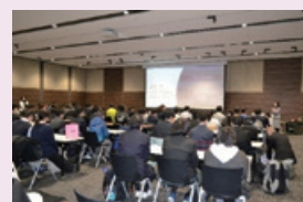
特別支援学校の高校生への体験型金融授業

持続可能な社会の実現を目指すべく、公正で質の高い金融教育、生涯学習の機会を積極的に提供するため、金融リテラシー講座や、店舗やオンラインなどによるセミナーの提供を行っております。 また、全国の障がい者の方々の方々の社会活動への参加促進および障がい者福祉の向上を目的に、特別支援学校の高校生へ卒業後のキャリア支援として、イオングループ各社と連携しショッピングセンターにて体験型金融授業を提供しております。