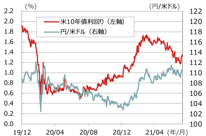
米10年債利回りと為替の推移

期間：2019年12月31日～2021年8月11日、日次