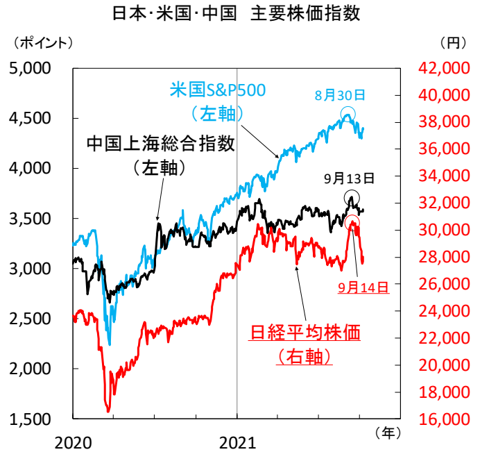
【図2】物価高で景気動向に警戒感、焦点は中国の回復に