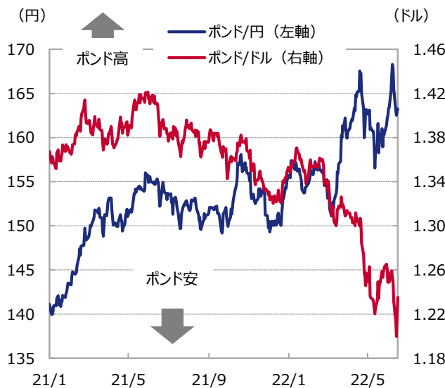
図表2 ポンドの推移

期間：2021年1月1日～2022年6月16日（日次）