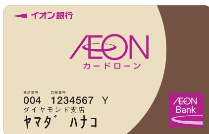
カードローンユトリプラン