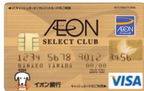
イオンセレクトクラブ