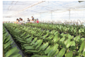
NPO法人AlonAlon(アロンアロン)オーキッドガーデンにおける胡蝶蘭の栽培