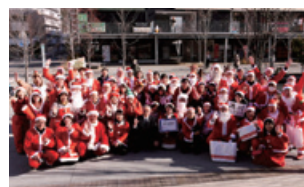
ボランティアサンタ (岩手県釜石市・大槌町)