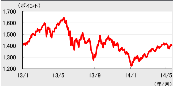
図1 SET指数 (2013/1/2~2014/5/20)

※SET指数はタイ証券取引所(SET)によって算出され、当該指数に関する著作権はSETに帰属しています。