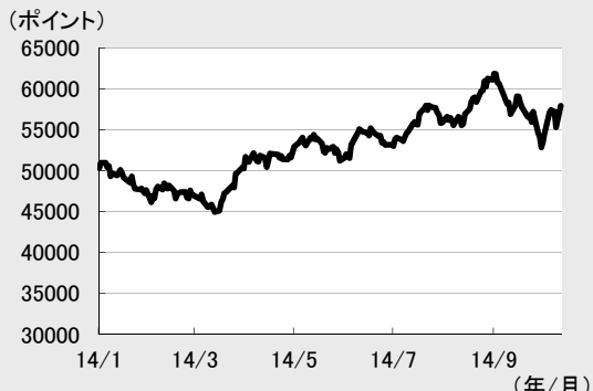
図表1 ボベスパ指数の推移 (2014年1月2日～2014年10月13日)