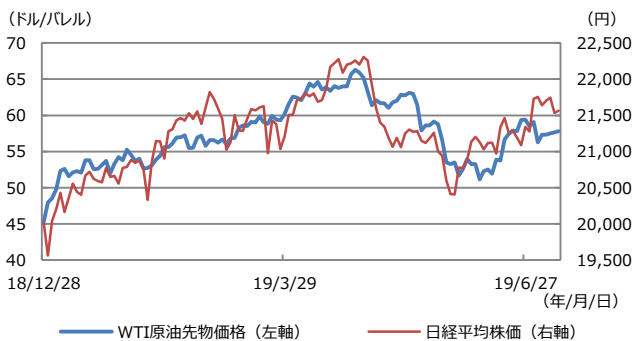
【図表1：WTI原油先物価格と日経平均株価】

(注) データは2018年12月28日から2019年7月9日。 (出所) Bloomberg L.P.のデータを基に三井住友DSアセットマネジメント作成