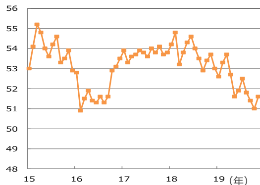
【サービス業PMI：グローバル】

(注) データは2015年1月～2019年11月。