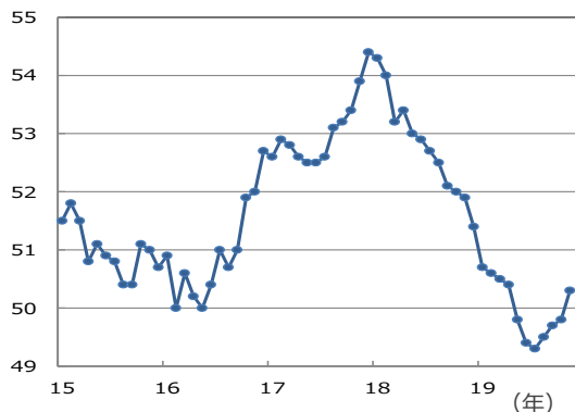
【製造業PMI：グローバル】

(注) データは2015年1月～2019年11月。 (出所) IHS Markit, Bloombergのデータを基に三井住友DSアセットマネジメント作成