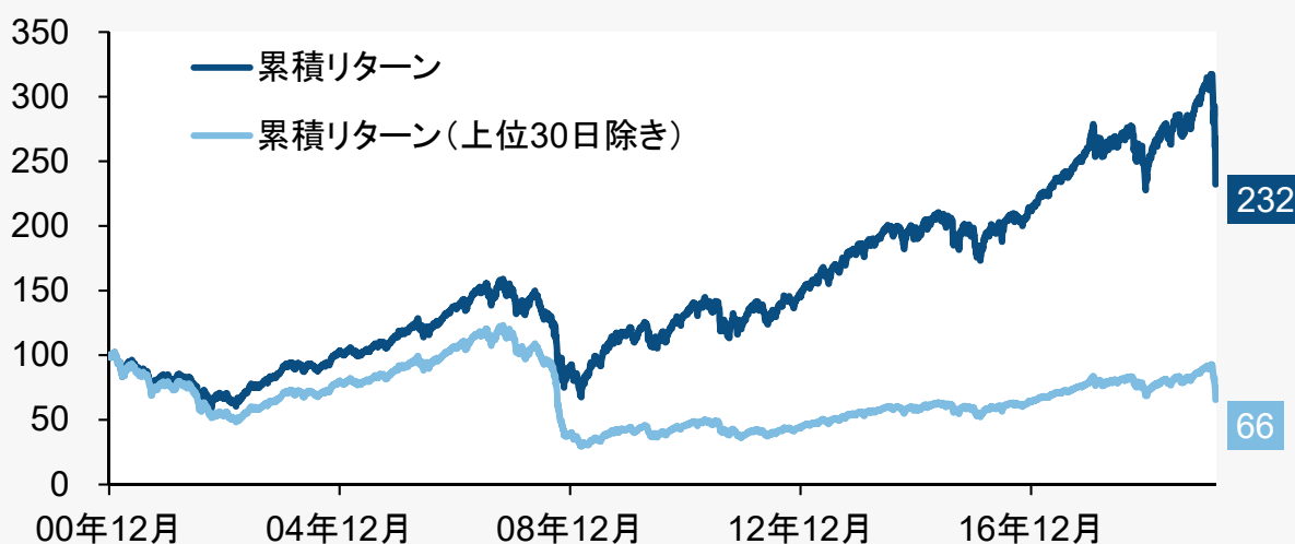
世界株式と、最も上昇した30日を控除した世界株式の推移(2000年末～2020年3月12日)

新型コロナウイルスの感染が広がる中、相場は様々なニュースに一喜一憂し、乱高下を繰り返しています。今回のレポートでは、そのような環境下だからこそ、今知っておきたい投資の“心得”をご紹介します。それは下落時こそ投資を継続する重要性と、積立投資の有効性です。