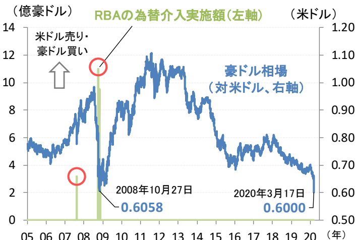
(期間) 2005年1月3日~2020年3月17日