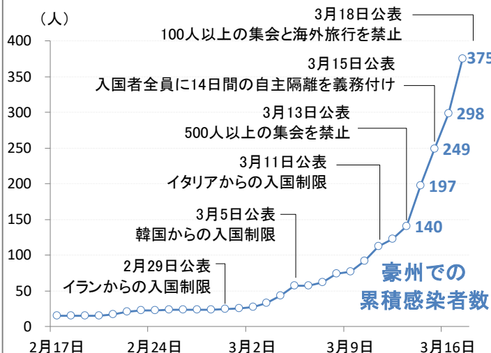
図1:豪州の新型コロナウイルスの累積感染者数と豪州政府の感染抑制策

(出所)世界保健機関(WHO)、各種報道 (期間)2020年2月17日~3月17日