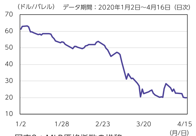
図表2： MLP価格指数の推移