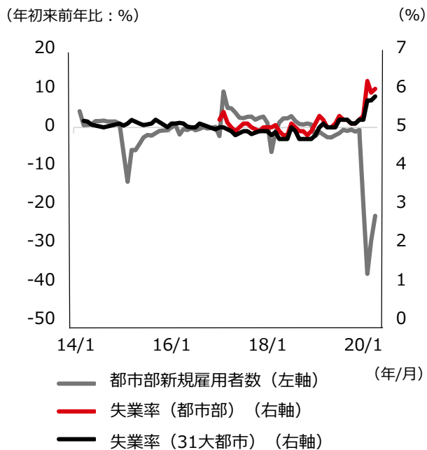
図表1：雇用の確保が最優先課題