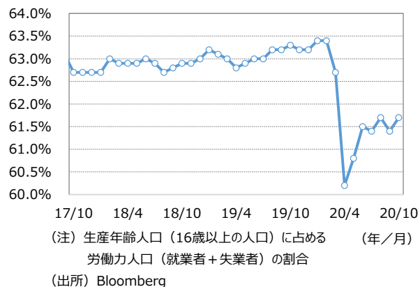
【図表3 労働参加率】 2017年10月～2020年10月、月次

10月の雇用統計は事前予想を上回るなど、労働市場は緩やかながらも順調に回復していることを示すものとなった。ただし、米国では新型コロナウイルス感染再拡大により再び営業活動停止の動きが広がる懸念も残る。また、米国大統領選挙・議会選挙では、上下院を制する政党が異なるねじれ議会の可能性が高まっている。追加の経済対策の規模が減額されれば、景気の重石になりかねない。10月の雇用統計は予想を上回る改善を示したが、先行きは依然不透明な状況にあるといえよう。