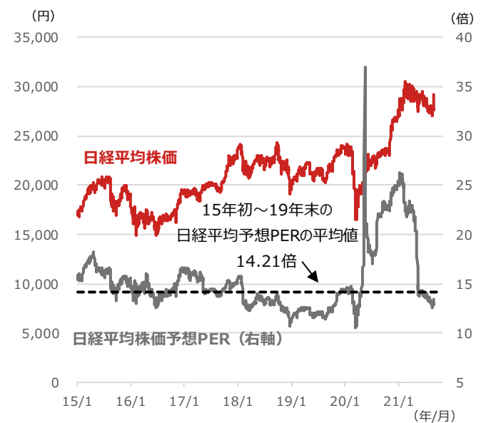
日経平均株価と同予想PER

期間：2015年1月5日～2021年9月3日、日次  点線部分は15年初からコロナショックが起きる19年末までの5年間の日経平均予想PERを平均化した水準。