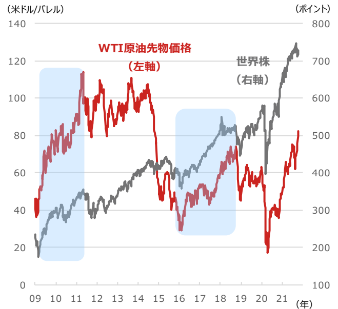
WTI原油先物価格と世界株

期間：2009年1月2日～2021年10月15日、週次 ・世界株：MSCI All Country World Index、米ドルベース ・網掛け部分はリーマン・ショック後、チャイナ・ショック後の原油高・株高局面 （出所）Bloombergより野村アセットマネジメント作成